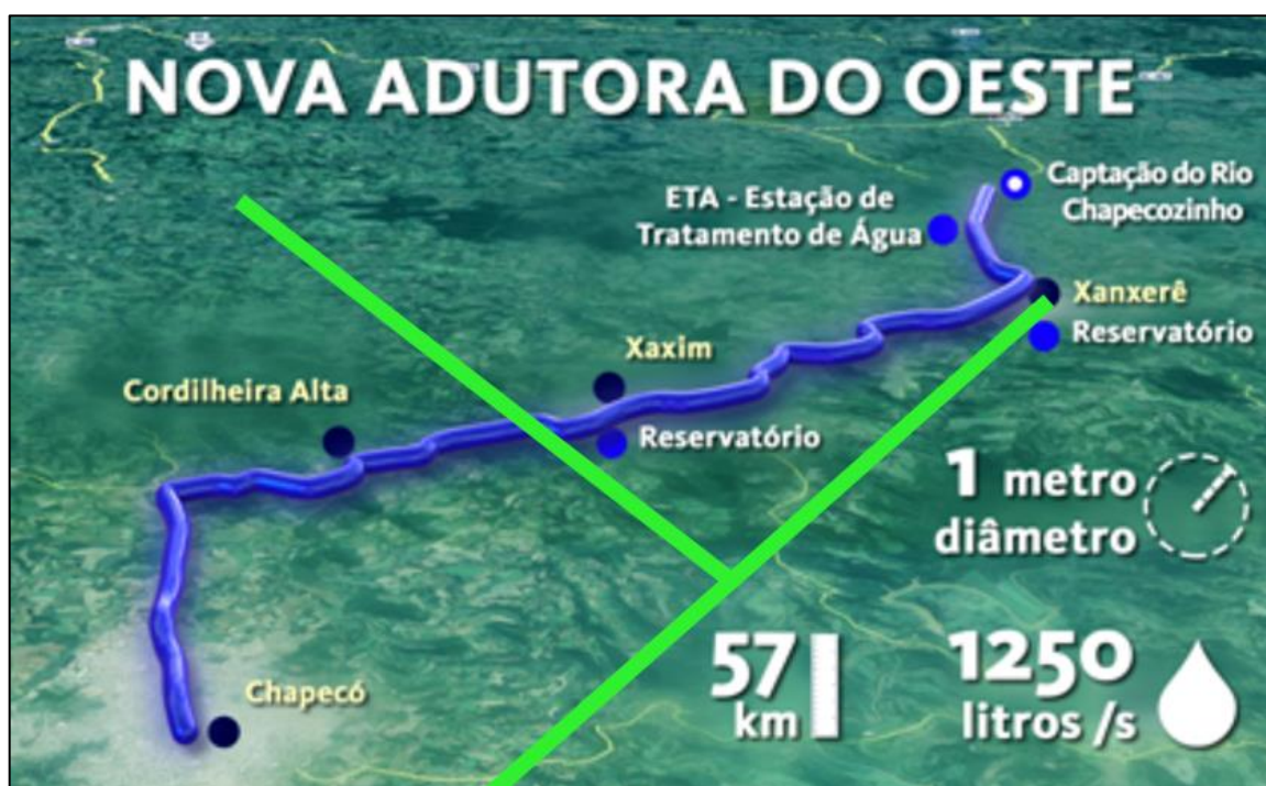
Figura 9.1. Representação ilustrativa do traçado previsto à Nova Adutora do Oeste (ou Adutora Rio Chapecozinho, em azul) em relação ao traçado aproximado das LTs sob análise (em verde claro).

Dentre os 43 projetos identificados no Painel de Obras + BRASIL, destaca-se a Nova Adutora do Oeste (ou Adutora Rio Chapecozinho Quadro 9.1), que consiste em uma adutora de água bruta e tratada com comprimento aproximado de 57km e diâmetro de 1m, capaz de conduzir 1.250 litros por segundo. A adutora citada atenderá aos municípios de Chapecó, Cordilheira Alta, Xaxim e Xanxerê, devendo cruzar futuramente o traçado da LT em algum ponto entre as comunidades de Linha Pilão de Pedra, Tigre ou Colorado, no município de Xaxim. Atualmente, porém, apesar da licitação ter sido homologada em dezembro de 2018, até o momento da elaboração desse diagnóstico, não foram constatadas movimentações de construção civil.