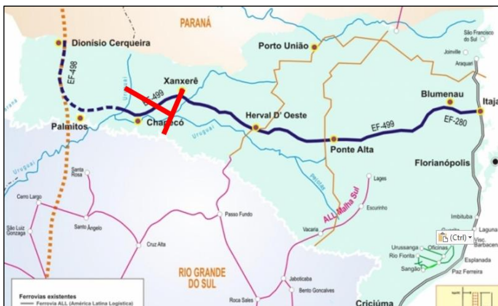
Figura 9.3. Em azul escuro, o traçado previsto para a EF-499 (Corredor Ferroviário de Santa Catarina) em relação ao traçado aproximado dos empreendimentos analisados, em vermelho.

Ainda no âmbito de prováveis grandes obras para os próximos anos, cumpre citar o projeto da EF-499 ou Corredor Ferroviário de Santa Catarina (Figura 9.3), também conhecida como Ferrovia Leste-Oeste ou Ferrovia do Frango, que facilitará o escoamento da produção agrícola do interior catarinense para os portos litorâneos (especialmente Itajaí, São Francisco do Sul e Itapoá), com previsão de início entre 2024 e 2026.